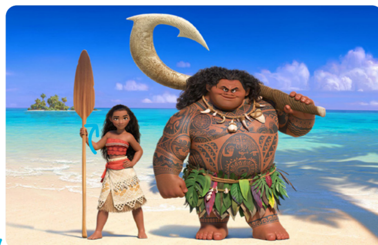
Vaiana, la légende du bout du monde se déroule en Polynésie.

Dans les premiers Disney, la plupart des héros étaient européens ou nord-américains. Les histoires récentes, elles, se passent partout dans le monde .