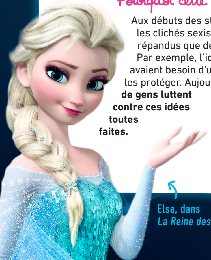
Elsa, dans La Reine des Neiges .