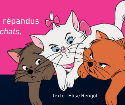
Texte : Elise Rengot.

D'anciens Disney contiennent certains clichés racistes, répandus à l'époque de leur sortie. Par exemple, dans Les Aristochats , il y a des clichés sur les Asiatiques. C'est pourquoi, actuellement, sur la plateforme Disney+, un message alerte les spectateurs sur ces clichés.