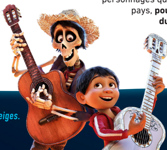
L'histoire de Coco se passe au Mexique.