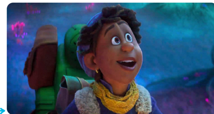
Dans Avalonia, l'étrange voyage , Ethan est le premier héros Disney amoureux d'un garçon.

Dans les premiers Disney, certains personnages correspondent à des modèles précis. Par exemple, le prince charmant amoureux d'une princesse. Les héros récents ne sont pas tous comme ça .