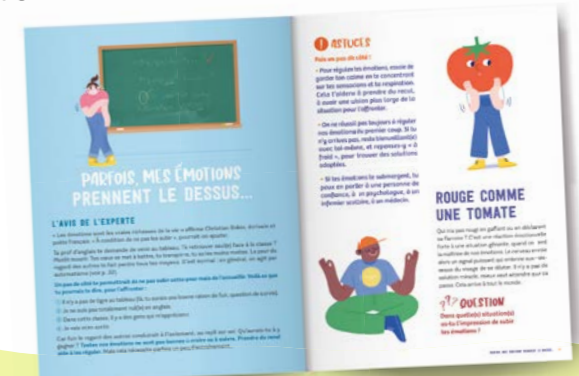
Illustration : Océane Meklemberg.