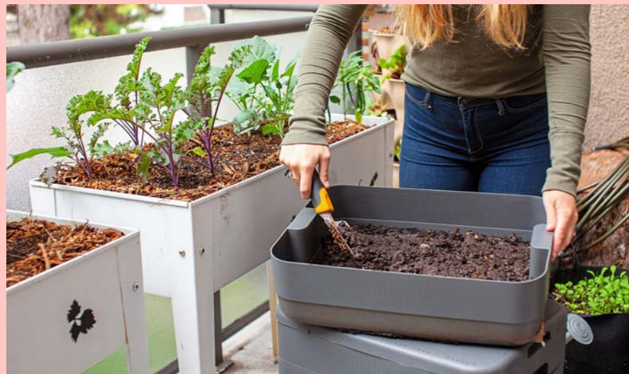
Le compost va nourrir la terre et aider les légumes à pousser.

Aujourd'hui, un tiers de la poubelle est rempli de ces déchets alimentaires. Alors, s'ils sont triés et compostés, le reste des déchets va diminuer. Il y aura donc moins de poubelles à collecter et à transporter , donc moins de carburant utilisé, et donc moins de pollution et d'énergie consommée !