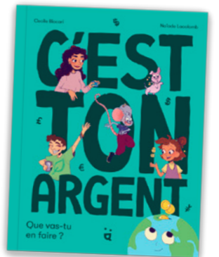
Textes : Sandra Laboucarie.

C'est ton argent. Que vas-tu en faire ? de C. Biccari et N. Lacolomb, éditions Helvetiq.