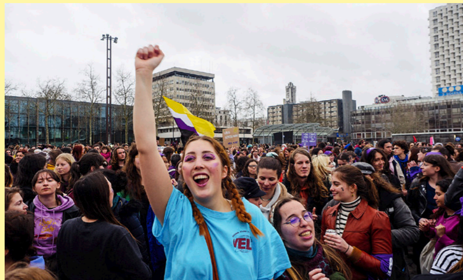
Le 8 mars, c'est la Journée internationale des droits des femmes. Des manifestations ont lieu, chaque année, à cette occasion.

En France, la loi interdit les actes et les insultes sexistes. Mais cela ne suffit pas à les faire disparaître ! Il est donc essentiel d'apprendre à reconnaître les comportements et paroles sexistes, à l'école, à la maison et sur Internet. Car, filles ou garçons, tout le monde doit avoir les mêmes droits.