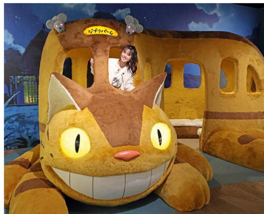
Le souriant chat-bus de Mon voisin Totoro .