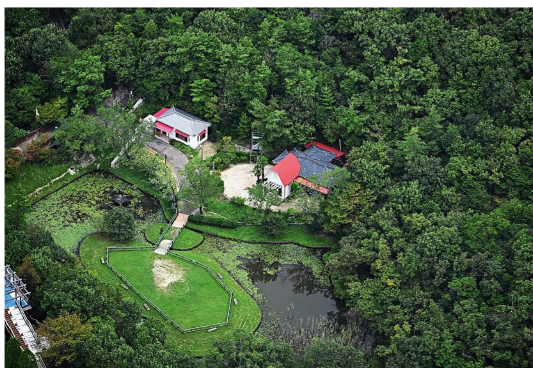
Sur cette photo aérienne du parc, tu vois la maison de Satsuki et Mei dans la forêt.

Comme la nature tient une place essentielle dans les dessins animés du studio Ghibli, elle est aussi très présente dans le parc.