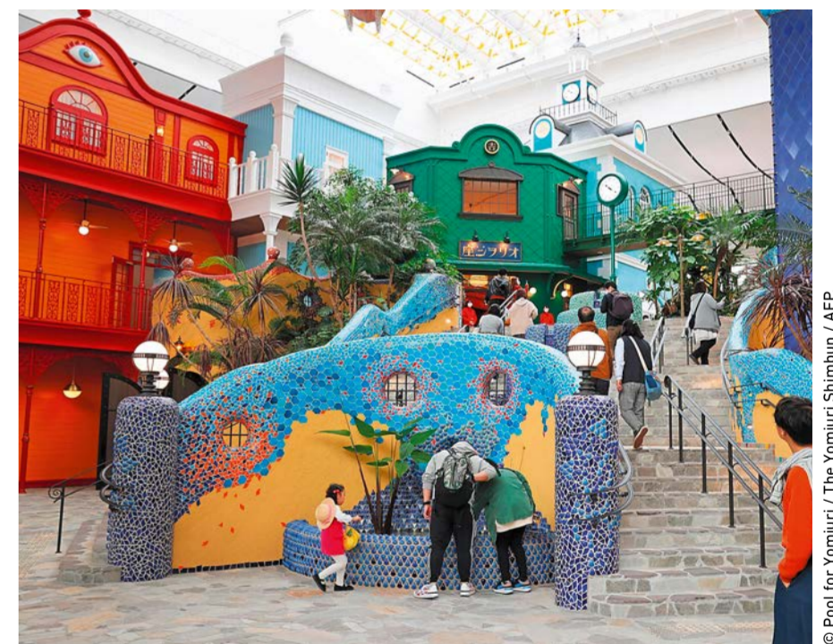
L'intérieur de l'entrepôt Ghibli, avec des décorations et des magasins.