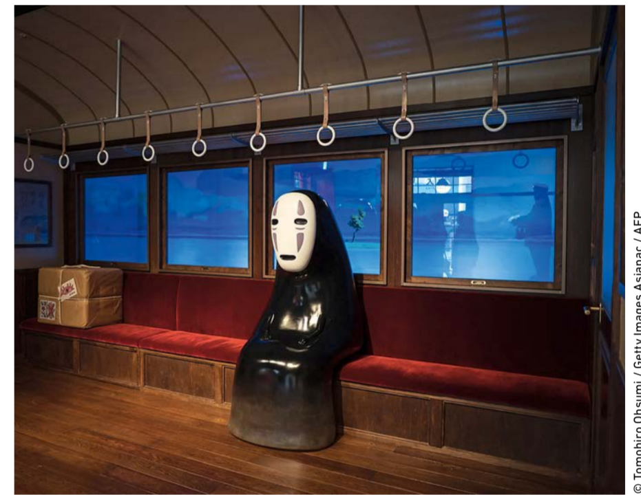
Le mystérieux personnage du Sans-Visage dans Le Voyage de Chihiro .