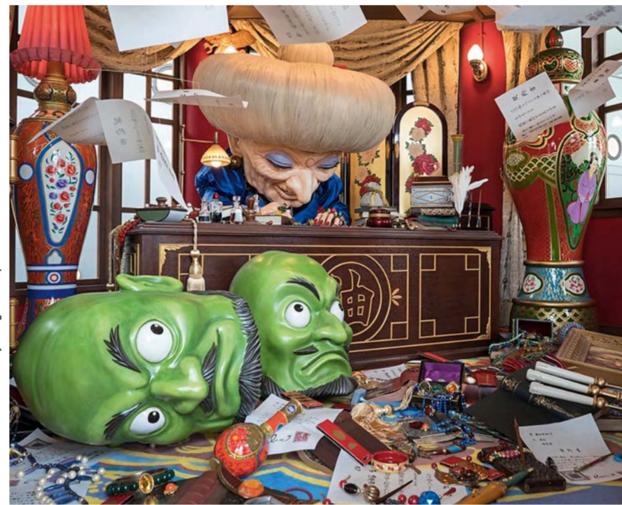
La sorcière Yubaba, rencontrée par Chihiro pendant son voyage.