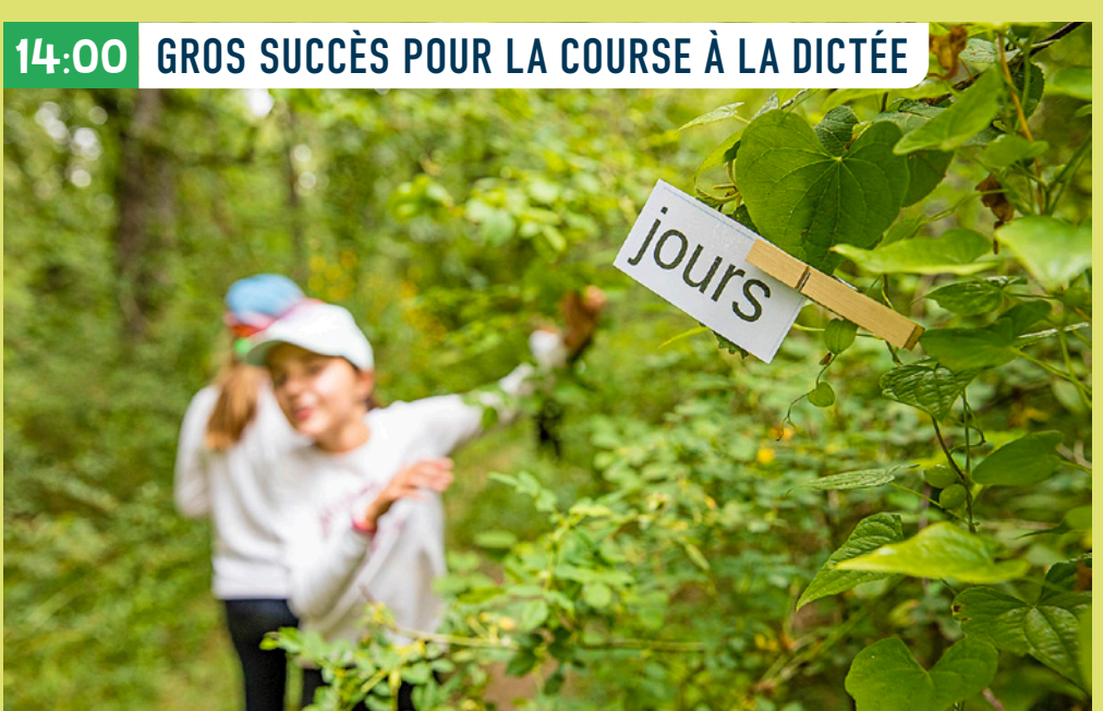
14:00 GROS SUCCÈS POUR LA COURSE À LA DICTÉE

Après le pique-nique, action ! Par groupe de trois ou quatre, on passe à la construction de cabanes en utilisant les éléments naturels trouvés autour de soi. Pratique pour ensuite faire un temps de lecture, bercés par le chant des oiseaux.