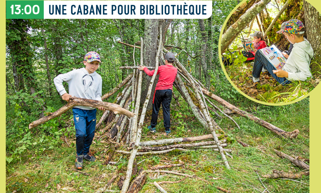
13:00 UNE CABANE POUR BIBLIOTHÈQUE

Des écorces pour représenter les milliers, des feuilles pour les centaines, des fleurs pour les unités. Une fois ce code défini ensemble, chaque élève a dû composer un grand nombre, puis l'a fait deviner à un camarade. Faire des maths n'a jamais été si joli.