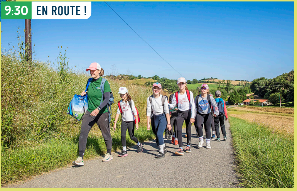
9:30 EN ROUTE !

Quand on fait l'école dehors, les relations avec l'enseignant sont plus décontractées. Les élèves de Montpezat le confirment : ce jour-là, ils aiment encore plus leur maîtresse. Et... si c'était aussi un moyen d'aimer (encore) plus l'école ? 😊