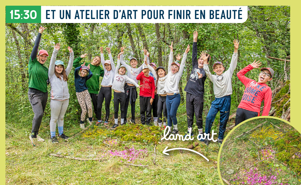
15:30 ET UN ATELIER D'ART POUR FINIR EN BEAUTÉ

Après une pause philo sur l'importance des petits gestes écolos, le cours d'anglais a sonné ! Nos explorateurs repartent pour une course aux trésors. Consigne : rapporter five purple flowers, seven long sticks, six stones... Do you understand?*