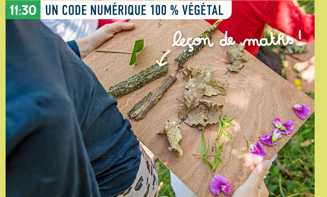
11:30 UN CODE NUMÉRIQUE 100 % VÉGÉTAL

Quelle surprise ! Un poulain tout juste né, dans les pattes de sa maman. Faire l'école dehors, c'est ça aussi : des rencontres auxquelles on ne s'attendait pas. Le monde vivant à portée de museau, ça rend curieux. Et c'est top pour les caresses !