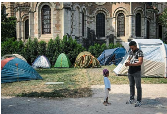
Sur cette photo prise à Toulouse, on voit des tentes de familles sans abri.

Selon une étude, au moins 2 000 enfants n'ont pas de logement en France. En fait, ils sont encore plus nombreux, mais tous n'ont pas pu être comptés.