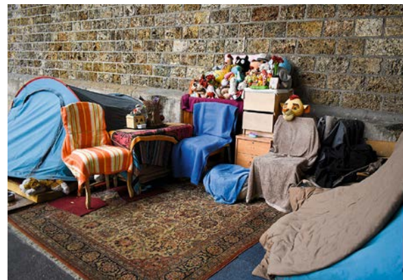
Ici, des personnes qui vivent à la rue, à Paris, ont recréé un salon avec des meubles et des jeux d'enfants.